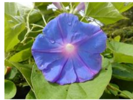
野朝顔(ノアサガオ)