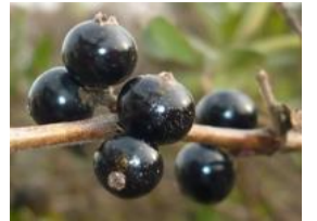
吸葛(スイカズラ)の実