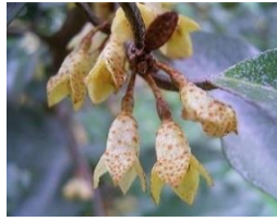
苗代菜萸(ナワシログミ)