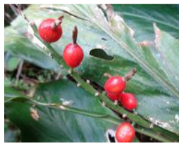
花茗荷(ハナミョウガ)の実