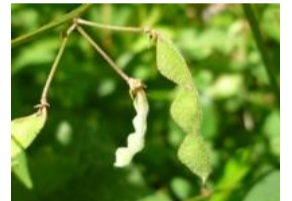
荒地の盗人萩(アチノヌスビトハギ)の実