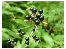
藪茗荷(ヤブミョウガ)の実