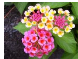
七変化(シチヘンゲ)