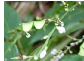
盗人萩(ヌスビトハギ)の実