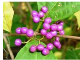
紫式部(ムラサキシキブ)の実