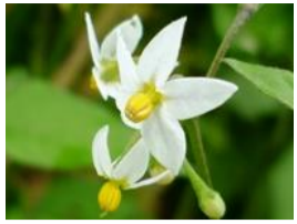
犬鬼灯(イヌホオズキ)