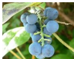
青葛藤(アオツブラフジ)の実