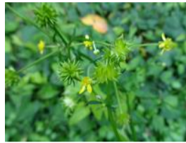
狐の牡丹(キツネノボタン)の実