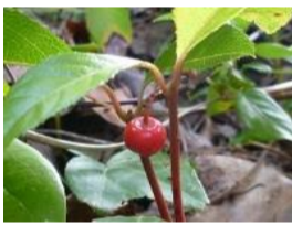
菽柑子(ヤブコウジ)の実