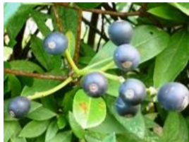
車輪梅(シャリンバイ)の実