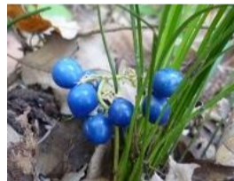
蛇の髭(ジャノヒゲ)の実