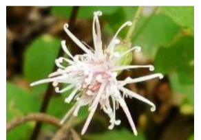
高野箒(コウヤボウキ)