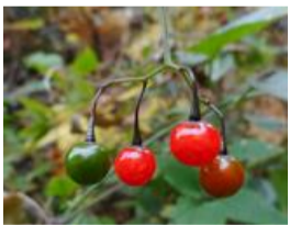
鶴上戸(ヒヨドリジョウゴ)の実