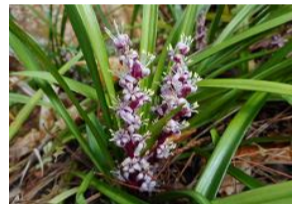
吉祥草(キチジョウソウ)