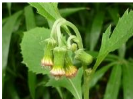
紅花檻樓菊(ベニバナボロギク)