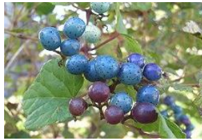
野葡萄(ノブドウ)の実