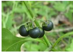
犬鬼灯(イヌホオズキ)の実