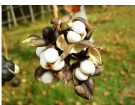
南京櫛(ナンキンハゼ)の実