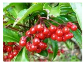
万両(マンリョウ)の実