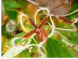
仙人草(センニンソウ)の実