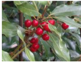
白楸(シロダモ)の実