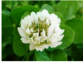
白詰草(シロツメグサ)