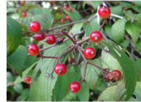
小葉莢蒾(コバノガマズミ)の実