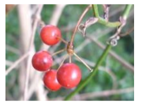
猿捕茨(サルトリイバラ)の実