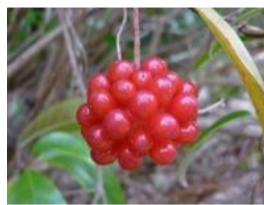
実葛(サネカズラ)の実