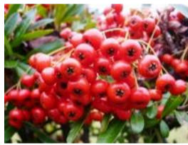
常盤山植子(トキワサンザシ)の実