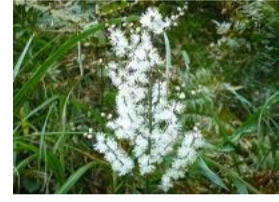
犬升麻(イヌショウマ)