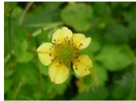
大根草(ダイコンソウ)