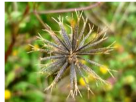
小梅檀草(コセンダングサ)の実