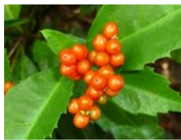
千両(センリョウ)の実