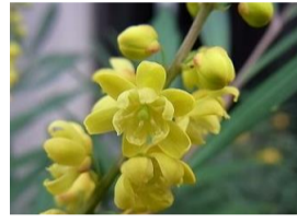
細葉柗南天(ホリヒイラギナンテン)