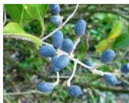
鼠糰(ネズミモチ)の実