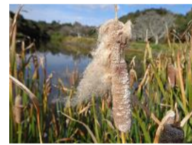
蒲(ガマ)の穂の中の綿毛