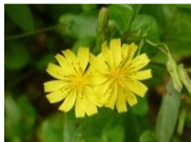
薬師草(ヤクシソウ)