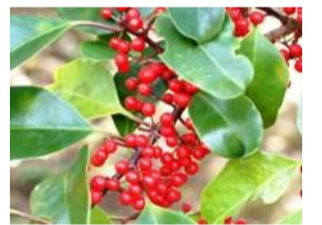
黒鉄糰(クロガネモチ)の実