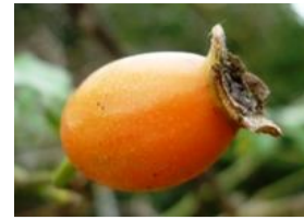
照葉野薔薇(テリハノイバラ)の実