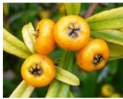
橘擬(タチバナモドキ)の実