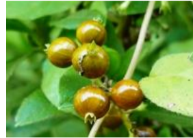
屁糞葛(ヘクソカズラ)の実