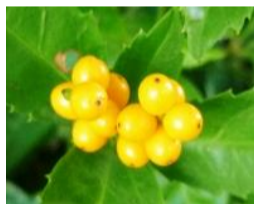
黄実の千両(キミセンリョウ)の実