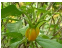
梔子(クチナシ)の実