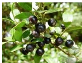
犬黄楊(イヌツゲ)の実