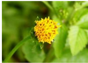
小梅檀草(コセンダングサ)