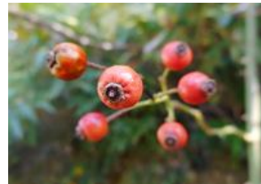
野茨(ノイバラ)の実