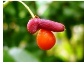
錦木(ニシキギ)の実