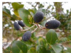
唐鼠糰(トウネズミモチ)の実