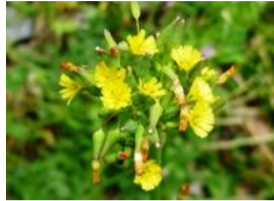
鬼田平子(オニタビラコ)