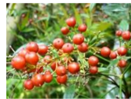
南天(ナンテン)の実