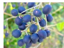
水蠟の木(イボタノキ)の実