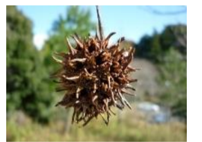
紅葉葉楓(モミジバフウ)の実