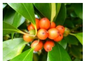
藜の木(モチノキ)の実