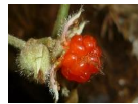
冬苺(フユイチゴ)の実