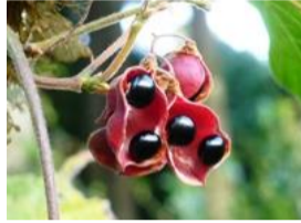
吐切豆(トキリマメ)の実